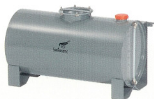
Depósito de preparación química en acero inoxidable, capacidad 69 l, SWINGFOG SN 101 Pump