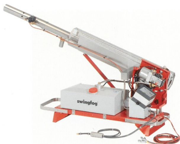
SN 101 PUMP