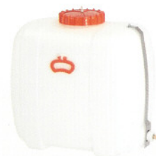
Depósito de preparación química en polietileno, capacidad 150 l, SWINGFOG SN 101 Pump (también disponible con capacidades de 80 l, 300 l, 500 l)